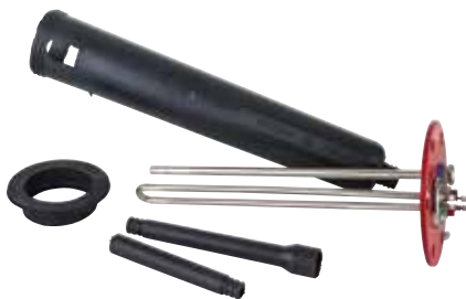
70150 | חמם קומפלט גוף חימום סיליקון ללא תרמוסטט 6000005 | חמם מתאים לדוד "אמקור" 6000006 | חמם מתאים לדוד "כרומגן"