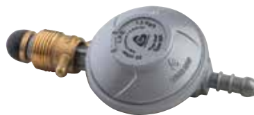
83203 | ווסת לגז הברגה חיצונית לצינור גומי כמות בקרטון: 60 יח'