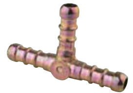
8302 | טע לצינור גומי לגז