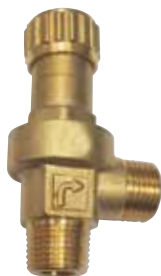
1167 | ברז בטחון לדוד 1/2"