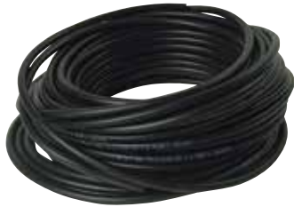
10210801 | צינור גומי לגז תיקני