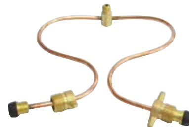
8322 | סליל בודד לגז 8321 | סליל כפול לגז - הברגה חיצונית כמות בקרטון: 50 83210 | סליל כפול לגז - הברגה פנימית כמות בקרטון: 1 יח'