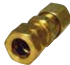
8313 | מחבר לצינור נחושת 6x6 8314 | מחבר לצינור נחושת 6x8 8315 | מחבר לצינור נחושת 8x8 8316 | מחבר לצינור נחושת 8x10 8317 | מחבר לצינור נחושת 10x10 83171 | מחבר לצינור נחושת 12x12 8332 | מחבר לצינור גז 12 מ"מ 1/2" חיצוני