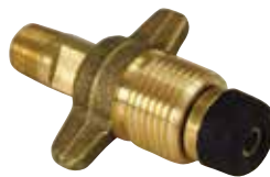
8323 | חיבור ממיכל (P.O.L) לווסט