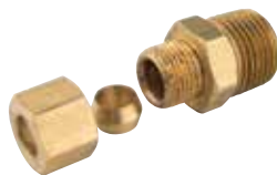
8325 | יציאה מווסת לצינור 5/16" 8326 | יציאה מווסת לצינור 3/8" 83249 | יציאה מווסת לצינור 1/4"