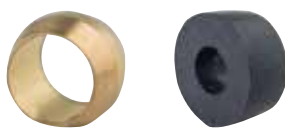
83211 | אטם לסליל כפול 8305 | עין 6 מ"מ לגז 83051 | עין 8 מ"מ לגז 8306 | עין 10 מ"מ לגז 83061 | עין 12 מ"מ לגז