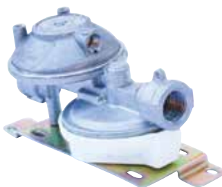
83204 | ווסת דו שלבי