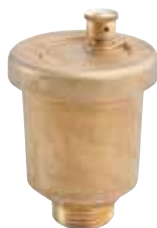
264760 | משחרר אוויר 1/2" כמות בקרטון: 60 יח'