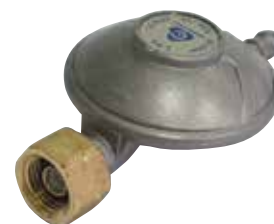
83202 | ווסת לגז הברגה פנימית לצינור גומי כמות בקרטון: 60 יח'