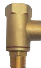
1164 | אל-חוזר לדוד