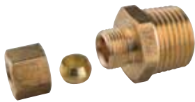
8318 | מחבר לנחושת 5/16" מברזל 1/2" 8319 | מחבר לנחושת 3/8" מברזל 1/2"