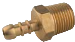
8327 | יציאה מווסת לצינור גומי