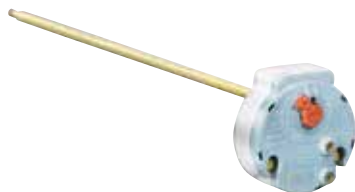
7000300 | תרמוסטט ארוך עגול THERMOWATT איטליה כולל חיווט כמות בקרטון: 100 יח' 70001 | תרמוסטט ארוך 35 מרובע כמות בקרטון: 50 יח' 70011 | גוף חימום ברגי סיליקון 2500W כמות בקרטון: 45 יח'